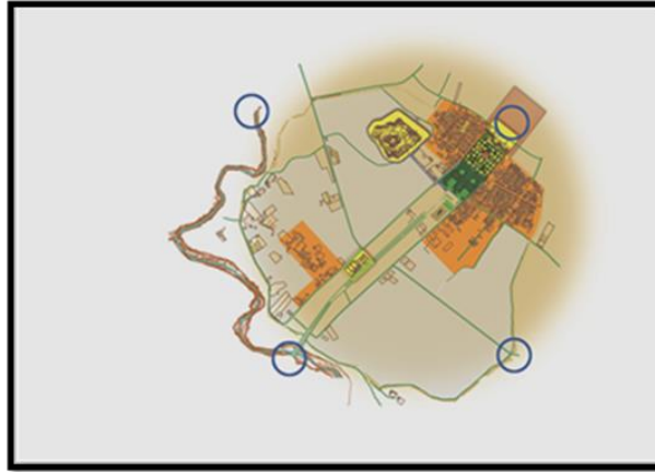
شکل (۲): موقعیت محدوده پیشنهادی برای انجام مطالعات

محدوده پیشنهادی برای انجام مطالعات در شهر تابران توس در شکل زیر موقعیت محدوده پیشنهادی برای انجام مطالعات نشان داده شده است