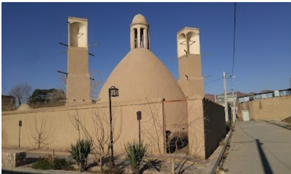
تصویر ۱۳: آب انبار آراد

روستای آراد که جزء دهستان حسن آباد که خود از بخش فشافویه شهرستان ری است، آب انبار منحصر به فردی که از آثار قدیمی دوره قاجار می باشد، دارای دو بادگیر در دوطرف یک گنبد بزرگ قرار دارد. این بنا در بالای گنبد نورگیری فانوسی شکل و مشبک دارد و گنبد آب انبار به شکل کله قند می باشد. ارتفاع آن ۱۰ متر و از خشت ساخته شده است. از این آب انبار برای ذخیره آب در روستا استفاده می کردند. ورود به آب انبار از ضلع جنوبی آن صورت می گیرد، که در ورودی آن آجر کاری زیبایی با طاق خوابیده کار شده است و دهانه آب انبار توسط پله های آجری تا عمق ۱۲ متر به پاشیر می رسد، روی پلکان های ورودی به پاشیر با آجر به صورت پلکانی تزئین شده است. تصویر ۱۳