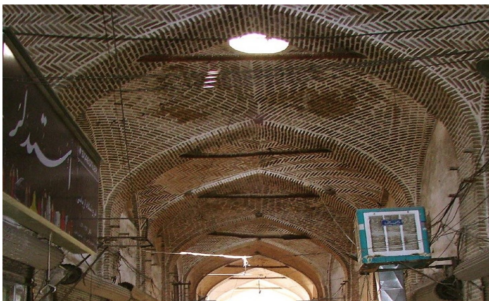
تصویر ۱۵: بازار بزرگ ری

بازار ری یکی از بازارهای تاریخی شهرری است که در شمال آرامگاه حضرت عبدالعظیم الحسنی می باشد. در دوران صفویه ساخته شده است. که متشکل از دو راسته بازار است که در محل تلاقی خود تشکیل یک چهار سوق را می دهند. این محل از قدیم الایام یکی از مراکز فروش ادویه، داروهای سنتی و کالاهای تجاری بوده که توسط بازرگانان از طریق جاده ابریشم وارد می گردید. این بازار دارای ساختاری متشکل از گچ، آجر، خشت و گل حدود ۵۰۰ سال پیش ساخته شده است. در زمان قاجاریه به فرمان امیر کبیر باز سازی شده است. تصویر ۱۵