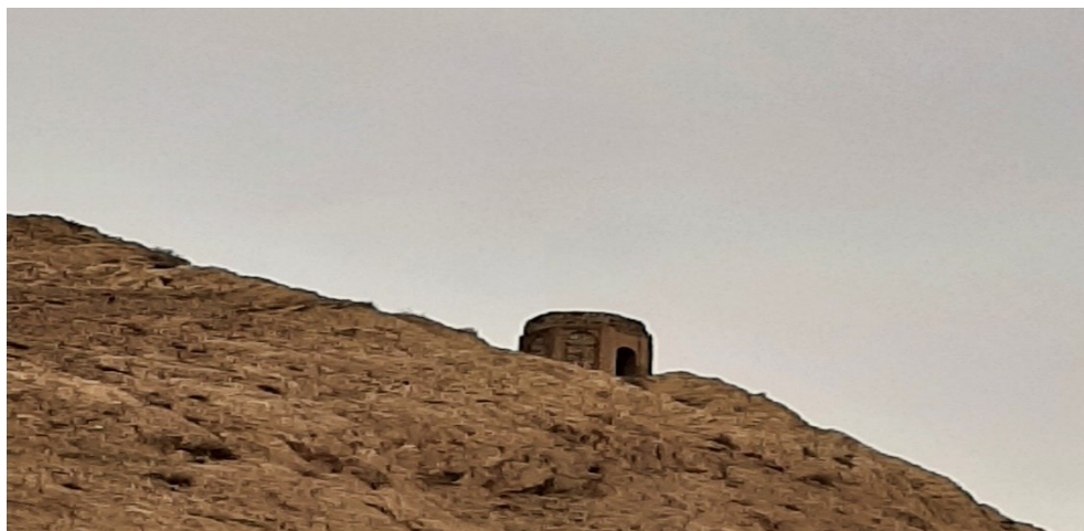
تصویر ۸: برج نقاره خانه