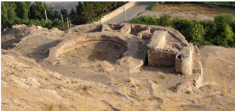
تصویر ۱۰: گنبد امیر اینانچ

این گنبد شامل محوطه ای وسیع و مدور است که قطر دایره آن محوطه حدود ۳۶ متر می- باشد و حفاری های انجام شده نشان می دهد که این برج در واقع گورستان سلطنتی بوده است. به اعتقاد بسیاری از مورخان این مکان به "سنقر اینانچ" ملقب به "حسام الدین" والی شهرری در دوره سلجوقیان منسوب است. به گفته مورخان سنقر اینانچ در آغاز از ملاکان سنجر بود، که پس از شکست خوردن از خراسان گریخت و به ری آمد و در اواخر عهد سلطان محمد بن محمود از سلاجقه عراق، ری را بدست آورده و والی ری شد. در آن زمان پیکری با هدایا به نزد سلطان فرستاد و اطاعت او را پذیرفت و چون سلطان محمد درگذشت، بلاد دیگر اطراف ری را نیز در اختیار گرفت. برج مدور اینانچ دارای ساختاری متشکل از لاشه سنگ و گچ است، و از آن به عنوان یک پادگان و محل دیده بانی نیز استفاده می شده است، این بنا در پای کوه طبرک ری پایین نقاره خانه واقع است. تصویر ۱۰