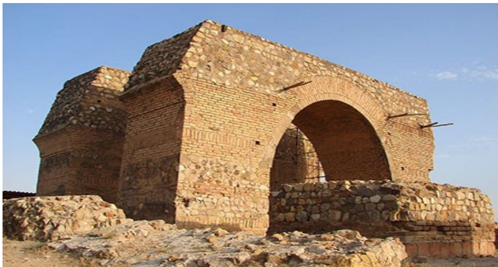
تصویر ۲: تپه میل یا آتشکده ری