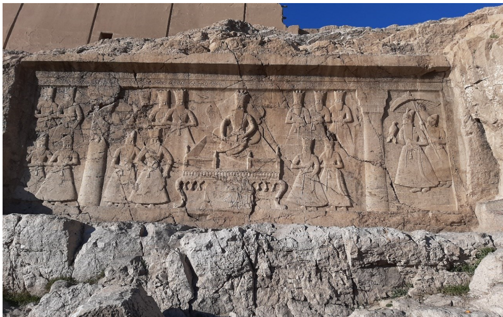
تصویر ۱۴: نقش برجسته ساسانی (دی ماه ۱۴۰۰)