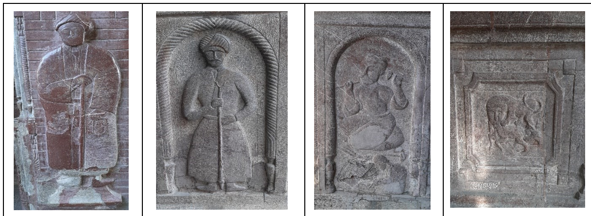
تصویر ۱۶: نقش برجسته های دوره قاجار (عکاس جمشید مطلب زاده دی ماه ۱۴۰۰)