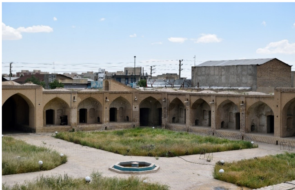
تصویر ۱۱: کاروانسرای کنار گرد

در وسط میدان فضای بزرگی که برای باراندازی و خالی کردن بارهای بسته بندی شده اختصاص داشت و در کنار این بار اندازها چندین شبستان، حجره و طاق نما وجود داشت که مرکز اتراق صاحبان کالاها، باربران و ساربانان بوده است. اسطبل های طولی پشت حجره ها و پیرامون کاروانسرا را فرا گرفته اند. در گوشه شمال شرقی کاروانسرا، یک حمام و یک آب انبار برای استفاده کاروانیان احداث شده است. علت نامگذاری این مکان (کنارگرد) روستایی به همین نام که در کنار کاروانسرا می باشد، بوده است. تصویر ۱۱