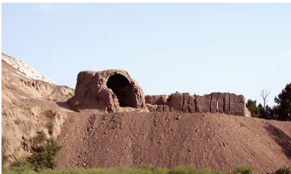
تصویر ۳: دژ رشکان

دژ رشکان در نزدیکی صفائیه شهرری و تپه چشمه علی قرار دارد. این دژ با ساختاری متشکل از لاشه سنگ و ساروج متعلق به دوره اشکانیان است. نام قلعه عظیم (رشکان) از کلمه (ارشک یکم) که بنیانگذار این سلسله پادشاهی بوده گرفته شده است، و دیگر پادشاهان این سلسله جهت افتخار کلمه ارشک را به نام خود اضافه می کرد. در این قلعه کاخ ها، اموالی گران بها و اسلحه خانه هایی وجود داشت، بخش های اصلی قلعه تا زمان قاجار نیز بر جا بود، اما امروز قسمت اعظم آن تخریب شده است. دیوارهای غربی این دژ دارای سوراخ هایی برای تیر و کمان است. ری در آن زمان (ارشکیه) نام داشته است. از این محل وسایل جنگی کهنه زیادی بدست آمده که در موزه ایران باستان موجود می باشد. این دژ محافظ هسته نخستین ری محسوب می شود. دژی که ساختار آن از سنگ و ساروج تشکیل شده و به دوره تاریخی اشکانیان تعلق دارد این قلعه ۲۳۰۰ ساله، میراث ارزشمند اشکانیان و پس از آن امپراتوری ساسانی است. تصویر ۳