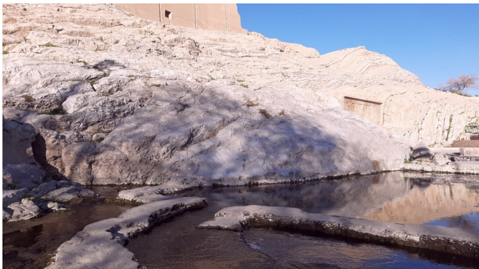
تصویر ۱: تپه باستانی چشمه علی (عکاس جمشید مطلب زاده دی ماه ۱۴۰۰)

کند. علت قطع شدن آب این چشمه باستانی را طرح متروی صفائیه شهرری که در مسیر این چشمه قرار داشت می- دانند. نام این چشمه به امام اول شیعیان باز می گردد، که مردم پیرامون آن در دوران اسلام بر آن نهادند، اما ایرانیان باستان این چشمه را سورنا(سورنا یا سورن فرزند آرش و ماسیس، سپهبد ایران در زمان اشکانیان بوده است، واصلتی ایرانی دارد)،(لغت نامه دهخدا)چشمه علی در گذشته آب زیادی داشته، چنان که آثارش در سنگ ها به جا مانده است. فتحعلی شاه قاجار که بیشتر برای گشتن به چشمه علی می رفت، در سال ۱۲۴۸هجری قمری دستور داد که در بالای چشمه علی سنگ نگاره ساسانی را هموار کرده و به جای آن نگاره خود را با گروهی از درباریان کنده کاری کنند. این تپه باستانی در ۲۵ فروردین ۱۳۱۳ با شماره ۲۰۲ به ثبت ملی رسید.(تصویر ۱)