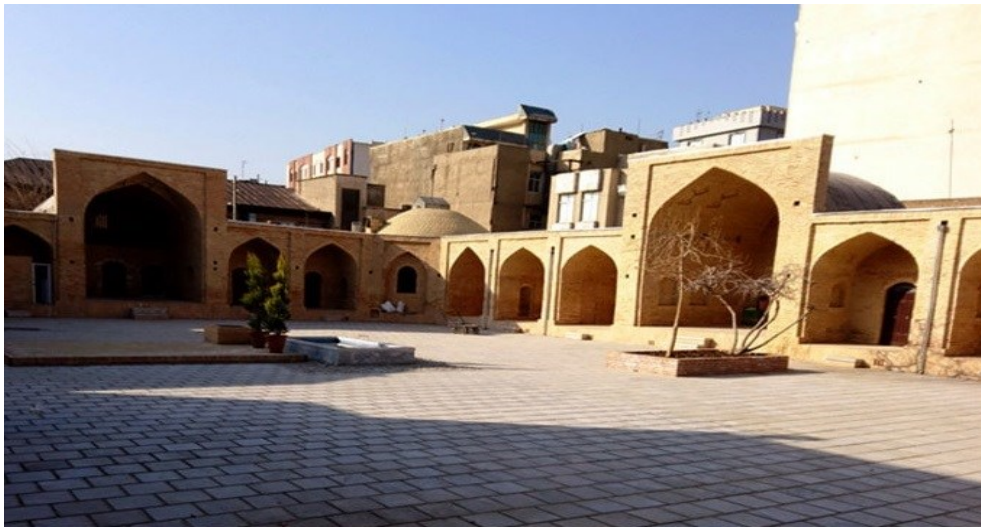
تصویر ۶: کاروانسرای شاه عباسی ری

کاروانسرای شاه عباسی در جنوب غربی میدان شاه عبدالعظیم الحسنی روبروی مسجد خاتم النبیین (ص) قرار دارد. مساحت آن حدود ۱۰۰۰ متر مربع می باشد. کاروانسرا کالبد توسعه یافته چارخانه های هخامنشیان است، که نخستین بار در تاریخ برای استراحت و تجدید توان پیک سواران و قاصدان دستگاه دولتی از شهر شوش در شمال خلیج فارس تا ساردین در غرب مدیترانه ساخته شدند. این کاروانسراها با معماری حیاط بزرگ مرکزی به صورت چهار ایوانه یا سه ایوانه طراحی و برای استراحتگاه بازرگانان و باراندازان کالاها ساخته شده اند، و در برخی موارد از آن برای استراحت زائران حرم عبدالعظیم الحسنی هم استفاده می - کردند. کاروانسرای شاه عباسی ری نیز چهار ایوانه بوده است. تصویر ۶