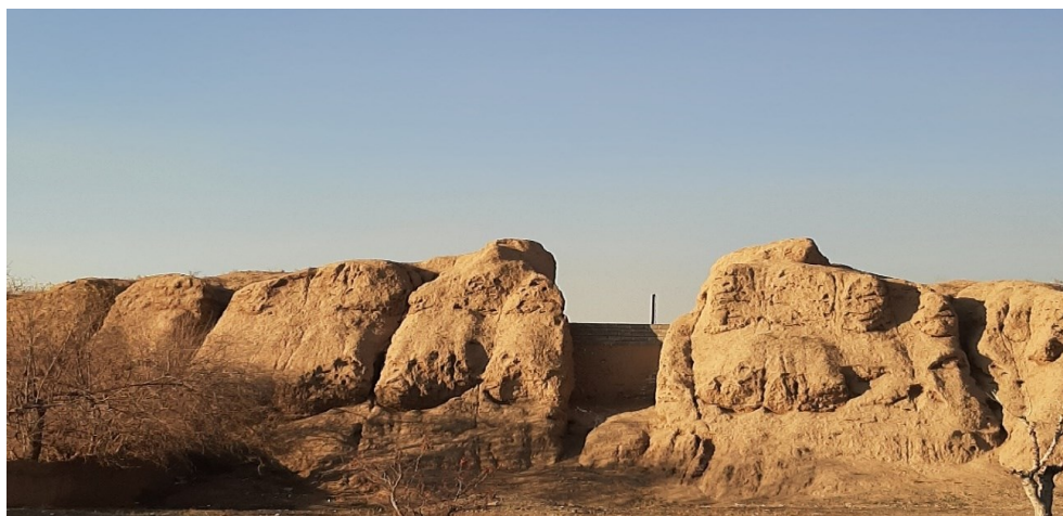
تصویر ۱۲: قلعه گبری، دوره ساسانیان

در جنوب شرقی شهرری قلعه مستحکم و طولی به نام قلعه گبری از دور نمایان است. این قلعه از بناهای قدیمی و مربوط به ۲۰۰۰ سال پیش می باشد. این قلعه مساحتی در حدود ۳۰۰۰ متر مربع دارد و در دوره ساسانیان ساخته شده است. برج و باروهای آن در طی قرن ها به دلیل فرسایش تخریب شده و امروز تنها دیوارهای طولانی و مرتفع از خشت و گل بر جا مانده است. از آنجا که فضای داخلی قلعه از اهمیت زیادی برخوردار نیست و به خاطر داشتن دیوارهای بلند از آن به عنوان انبار حرم حضرت عبدالعظیم الحسنی استفاده می کنند. بنا بر گفته مورخان "مرد آویج زیاری" بنیانگذار سلسله آل زیار (مرگ ۳۱۳ خورشیدی) در این مکان دفن شده است. تصویر ۱۲