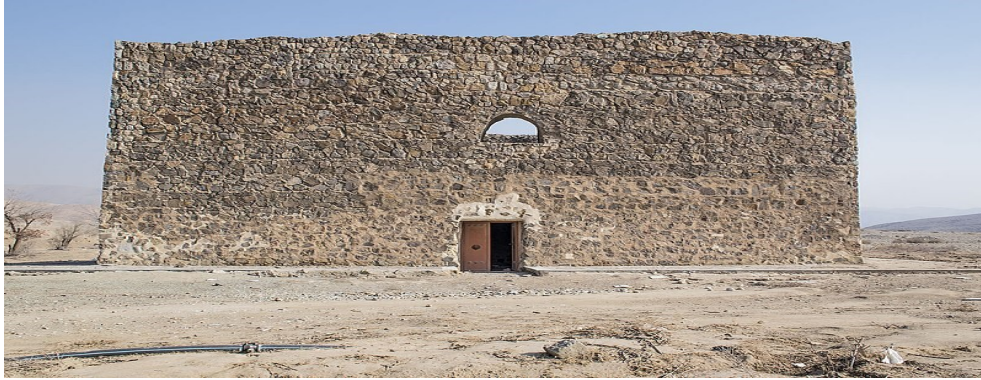
تصویر ۹: زندان هارون ری

به ارتفاع ۹ متر و به صورت دو طبقه ساخته شده و از درازا و پهنای یکسانی برابر با سی متر و سی سانتی متر برخوردار است. زندان هارون دارای ساختاری متشکل از لاشه سنگ و گچ و از نظر قدمت متعلق به دوره آل بویه حدود ۱۱۰۰ سال قبل می باشد. این بنا صرفاً به منظور زندان های انفرادی ساخته شده است. به عقیده "آندره گدار" بنای مزبور از زمان سلجوقی است و یکی از استحکامات نظامی آن عصر به شمار می آید. این اثر در تاریخ ۱۱ بهمن ۱۳۳۴ با شماره ثبت ۴۰۸ به عنوان یکی از آثار ملی ایران به ثبت رسیده است. تصویر ۹