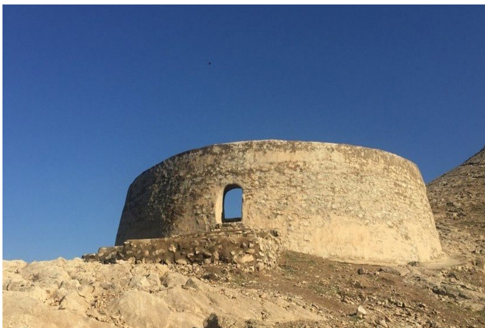
تصویر ۵: استودان یا استخوان دان گبرها

آستودان گبرها یا استخوان دان گبرها، در شهرری دامنه شمالی کوه بی بی شهربانو قرار دارد. در این محل زرتشتیان اجساد مردگان خویش را طعمه حیوانات می ساخته اند. تاریخ احداث این دخمه ظاهراً در زمان ساسانیان و شاید جلوتر برسد، زیرا اعتقاد داشتند دفن مرده در خاک، یا انداختن آن در آب رودخانه یا سوزاندن در آتش حرام است، چون عناصر چهارگانه (آب، باد، آتش، خاک) را مقدس و آلوده کردن آن را ناروا می دانستند؛ و استخوان آن را پس از جدا شدن گوشت و خشک شدن در استودان که از سنگ، آهک یا گِل می ساختند قرار می دادند. تصویر ۵