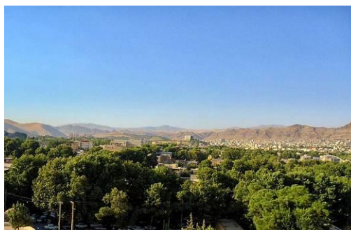
شکل ۴- دور نمایی از خیابان شهدا