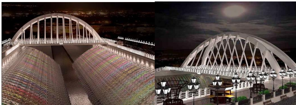
شکل ۳- شبیه سازی رودخانه و پل شهدا (خبرگزاری یافته، ۱۳۹۴)