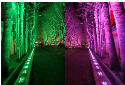
شکل ۵- نورپردازی خیابان شهدا

یکی از ویژگی های شاخص این خیابان وجود درختان سر به فلک کشیده آن می باشد که در دو طرف خیابان به صورت متقارن اجرا شده اند و در بالا به صورت یک طاق طبیعی البته از جنس درخت به هم پیوسته اند وانبوهی از درختان را در مرکز شهرم خرم آباد بوجود آورده است. همچنین عبور آب چشمه گرداب سنگی از این خیابان باعث ایجاد یک فضای دلنشین، خصوصا در فصول گرم سال شده است (شکل ۴). با توجه به اهمیت ویژه این خیابان در شهر خرم آباد، و وجود این عناصر طبیعی پروژه نورپردازی این خیابان در دستور کارمسئولین شهر خرم آباد قرار گرفت تا اجرای عملیات نورپردازی درختان خیابان شهدای خرم آباد به اجرا درآید و جانی دوباره بر این خیابان در دل شب بخشد.جدول گذاری با جدول سنگی گوهره به ابعاد ۱۰*۵۰*۱۰ و ۱۰*۴۰*۵۰ و ۱۰*۷۰*۵۰ به مقدار ۷۵۰ مترطول و بتن ریزی به میزان ۴۰۰ مترمکعب از جمله فعالیت های عمرانی و زیربنایی است که در طی اجرای این پروژه صورت گرفت(شکل ۵).